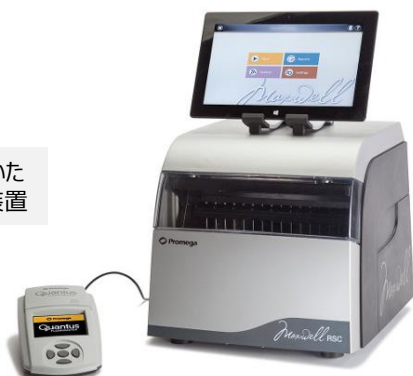
Maxwell® RSC Instrument (カタログ番号 AS4500)