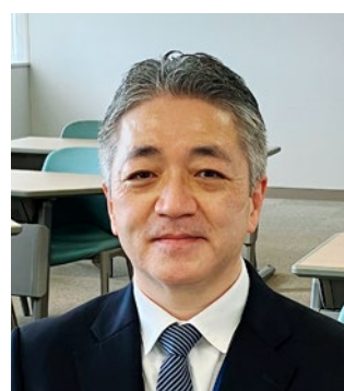
埼玉医科大学 医学部 ゲノム基礎医学